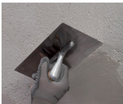
Applicazione di Mape-Antique FC Civile