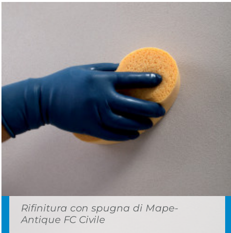
Rifinitura con spugna di Mape-Antique FC Civile