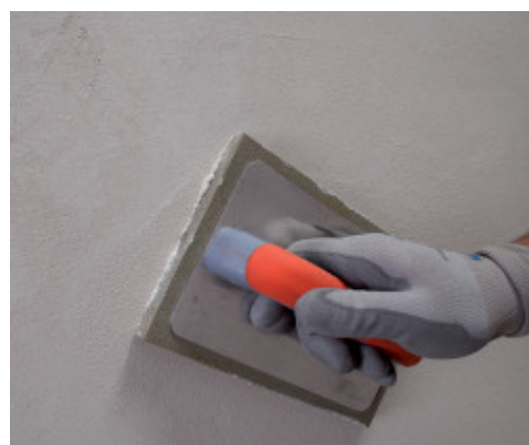
Rifinitura con frattazzino di spugna di Mape-Antique FC Civile