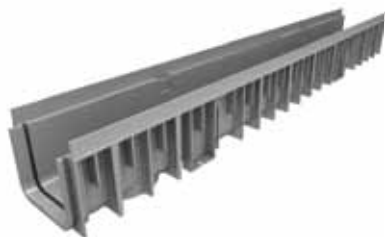
Canale grigio Nice 100/90