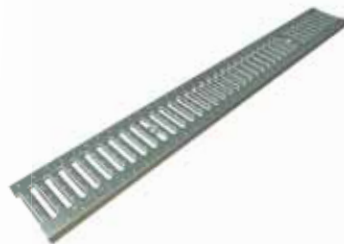
Griglia Pioli A/Z Nice