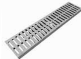
Griglia grigia PE/HD Nice