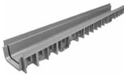
Canale grigio Nice 100/50