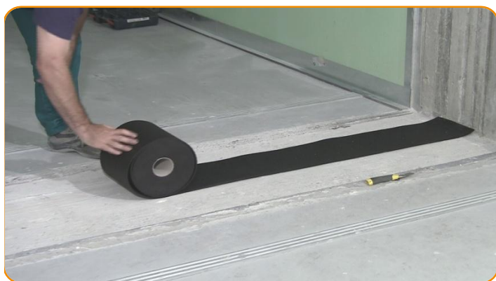
Stendere la striscia sottoparete