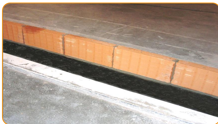
Realizzare la prima parete sopra la striscia sottoparete posandola su un letto di malta